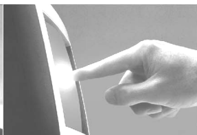
Diagnósticos & Medições