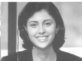
Cliente em 1º lugar